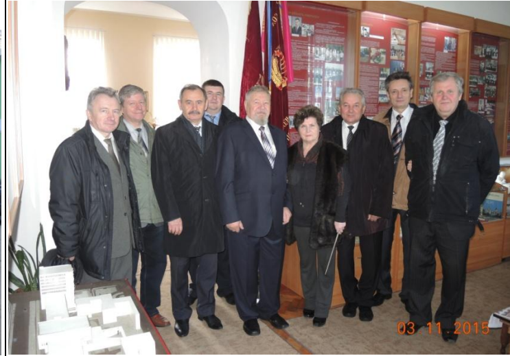
УЧАСНИКИ симпозиуму під час огляду музею ТДАТУ