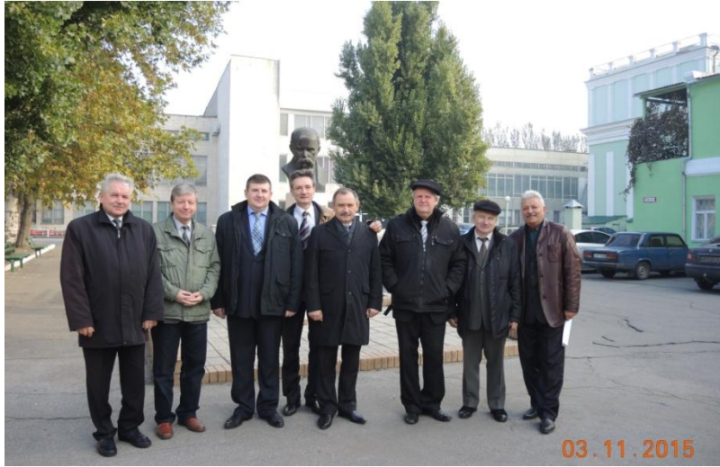
УЧАСНИКИ-ГОСТІ симпозиуму біля пам'ятника Т.Г. Шевченко поруч з головним корпусом ТДАТУ

Відбувся 3 листопада 2015 р., Таврійський державний агротехнологічний університет (ТДАТУ) м. Мелітополь, Запорізької обл.